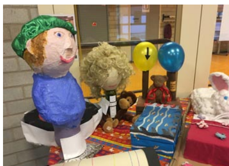
Enkele prachtige surprises

Stuur dan een mailtje naar Bert Wierenga (B.Wierenga@kinderenonderwijsrotterdam.nl). U bent van harte welkom!